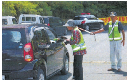
遠野 夏の交通事故防止県民運動啓発活動