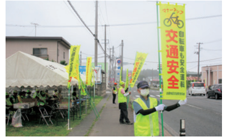
紫波 夏の交通事故防止県民運動啓発活動