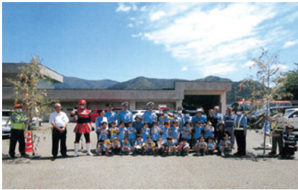
気仙 交通安全七夕掲揚式