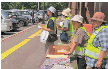
下北 夏の交通事故防止県民運動啓発活動