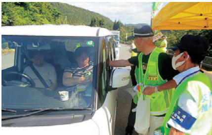
北上 交通安全街頭指導活動