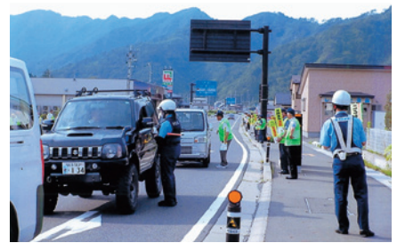
釜石 夏の交通事故防止県民運動啓発活動