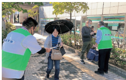
県安協 秋の全国交通安全運動啓発活動