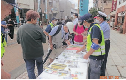
盛岡 反射材配布活動