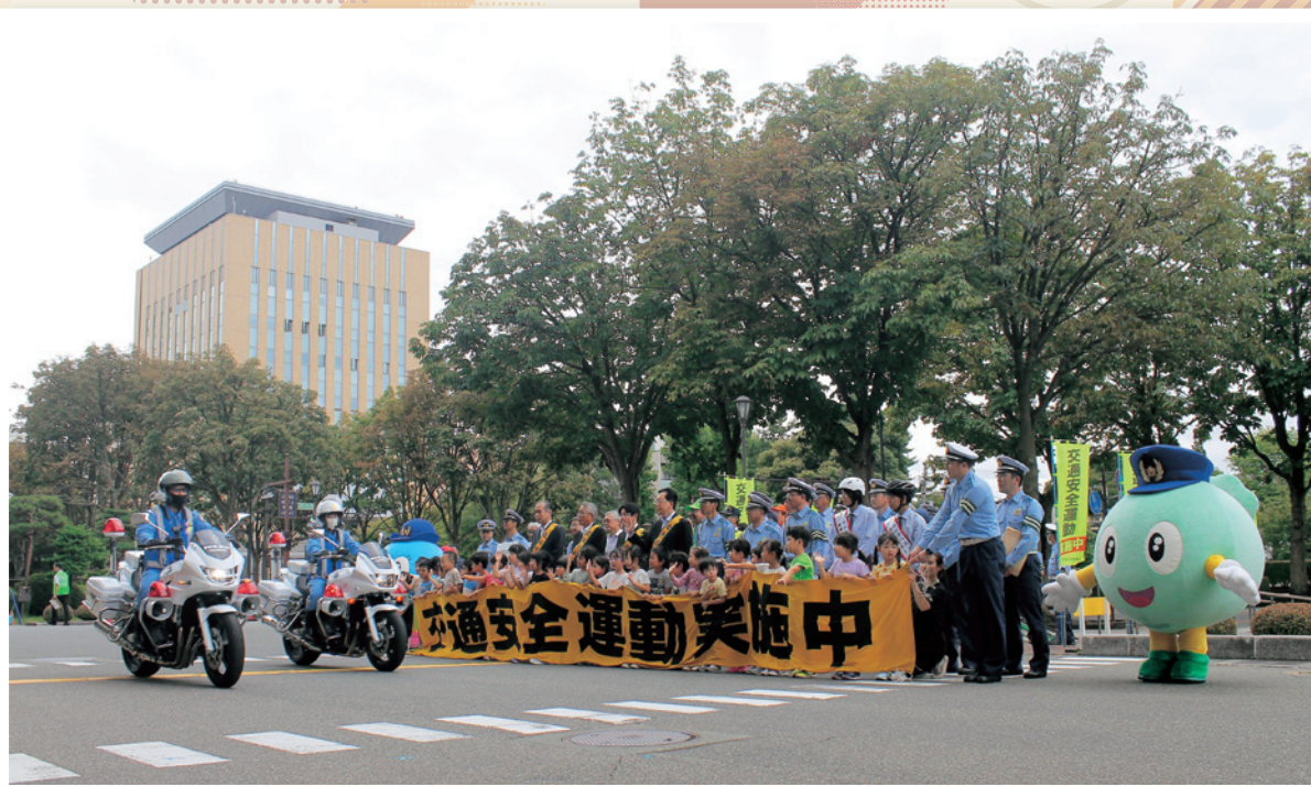
●秋の全国交通安全運動開始式

発行所 | 一般社団法人 岩手県交通安全協会 岩手県盛岡市天神町11番1号 TEL (019)652-4597 FAX (019)652-4599 http://iwateken-ankyo.jp/