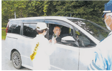
北岩手 目覚まし作戦