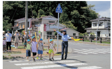
東磐井 幼児の交通安全教室