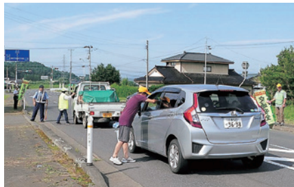
江刺 夏の交通事故防止県民運動啓発活動