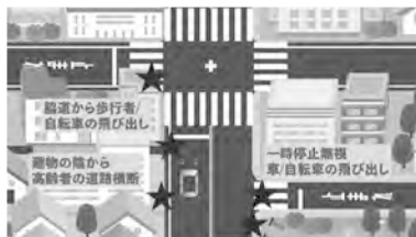
自車から見えないもの(死角)を探す