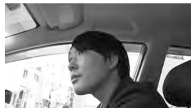
繰り返し確認し、変化を探す