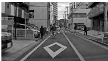
自車に接近の可能性があるもの(見えているもの)を探す

ここでは①～③で学んだことを踏まえ、リスクが高い道路にて『一歩進める安全運転』を実践します。