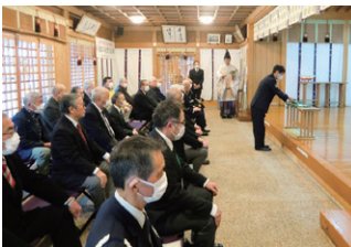
水沢 交通安全祈願祭