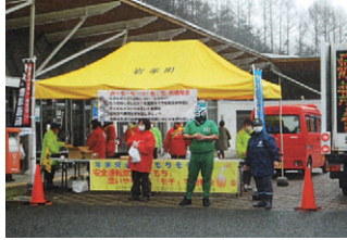
北岩手 餅&もち作戦