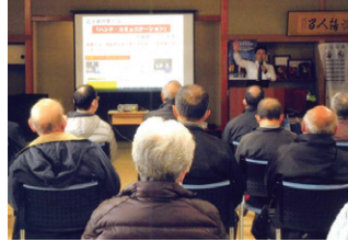
花巻 高齢者交通安全教室