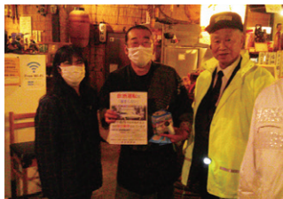
江刺 飲酒運転撲滅啓発活動