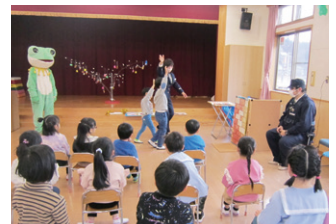
東磐井 幼児の交通安全教室