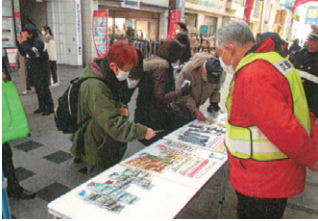
盛岡 高齢者反射材配布活動