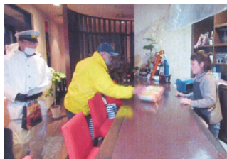
遠野 飲酒運転撲滅啓発活動