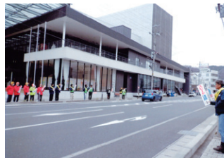
釜石 交通安全街頭啓発活動