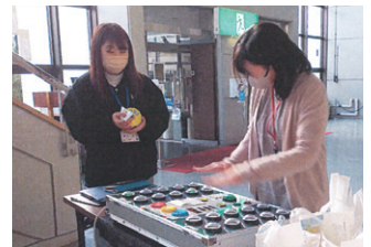
宮古 交通安全資機材体験