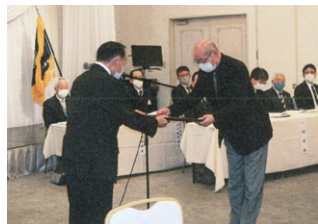
一関 交通安全活動コンクール表彰式