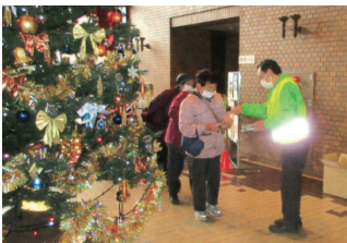
二戸 反射材普及活動