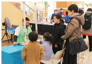
県安協 交通安全資機材体験