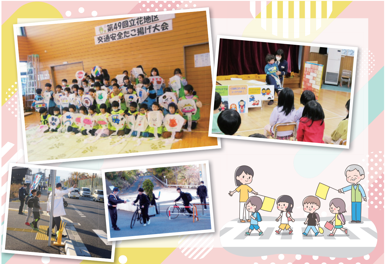
県内の交通安全活動の様子