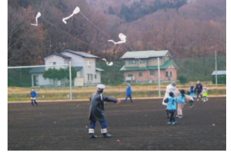
北上 交通安全たこ揚げ大会