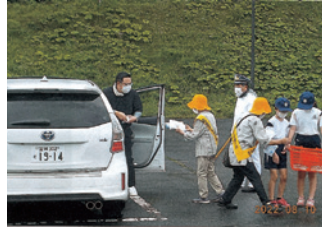
北岩手 目覚まし作戦