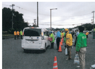
一関 交通・地域安全ポードレス作戦