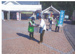
宮古 秋の全国交通安全運動街頭活動