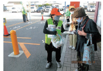
久慈 秋の全国交通安全運動街頭活動