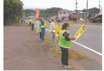
北上 ライト早め点灯街頭指導活動