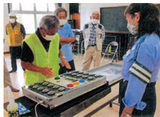
東磐井 高齢者交通安全教室