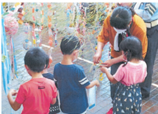
遠野 交通安全七夕