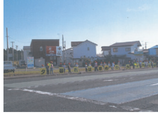
花巻 交通事故死ゼロを目指す日啓発活動