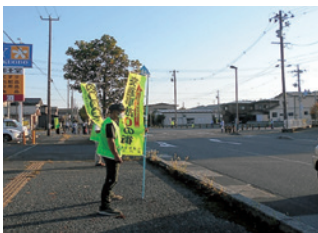
水沢 秋の全国交通安全運動街頭活動