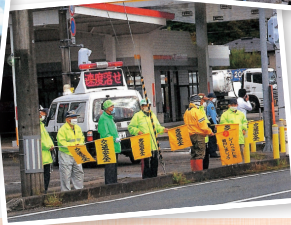
秋の全国交通安全運動