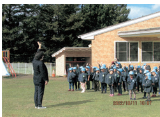
二戸 幼児交通安全教室