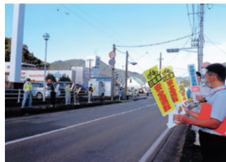
釜石 秋の全国交通安全運動街頭活動