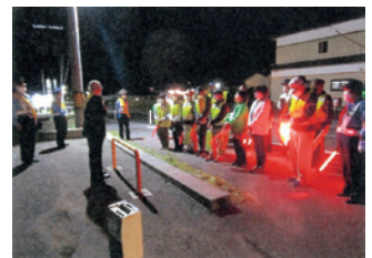
気仙 夜間薄暮時特別街頭指導