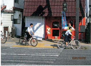
盛岡 自転車安全利用啓発活動