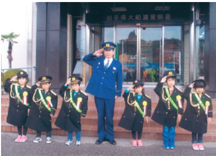
気仙 一日警察署長