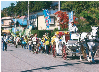
遠野 馬っ子交通安全パレード