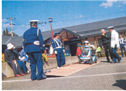
北岩手 シニアカー交通安全教室