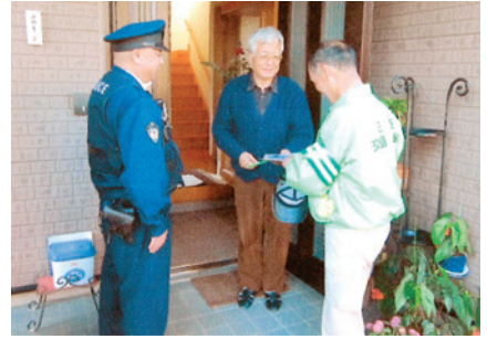
紫波 高齢者在宅家庭訪問