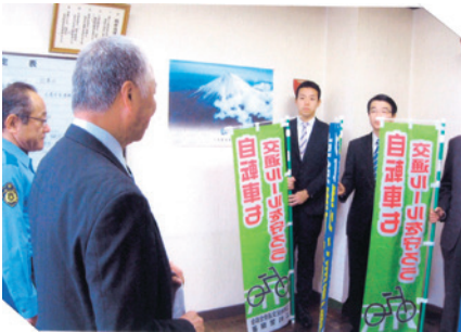
江刺 のぼり旗寄贈