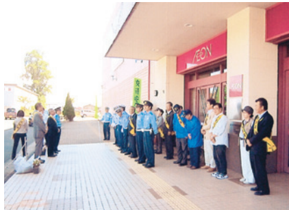
一関 黄色い羽根配布活動開始式