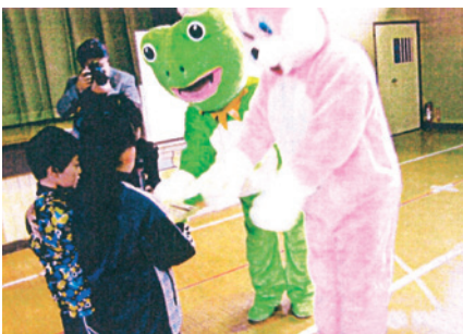
二戸 交通安全教室