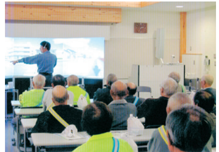
東磐井 シルバードライバー安全講習会