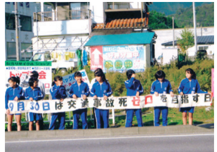
釜石 交通事故死ゼロを目指す日