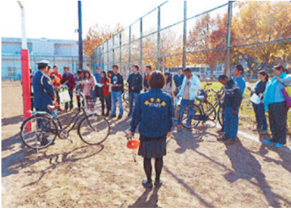
盛岡 自転車乗り方安全教室(岩手大学)