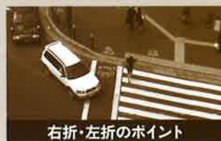
右折・左折のポイント

運転に慣れると、誰しもが「しているつもり of 安全運転」になってしまう可能性がある。そのことを忘れずに、常に危険への注意力を持ち続ける事が大切だ。