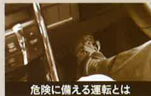
危険に備える運転とは