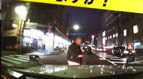
ドライブレコーダーが記録した事故映像の数々