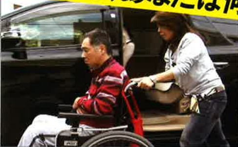
交通事故に合い、障害を負ってしまった方への取材