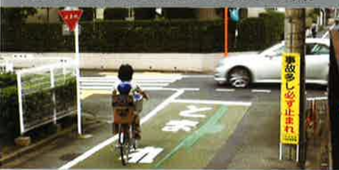
「自転車は一時停止を守るか?」定点観測