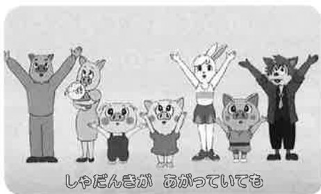
しゃだんきが あがっていても

追ってくるおおかみ。その正体は? 三兄妹は、無事病院にたどり着くことはできるのでしょうか?